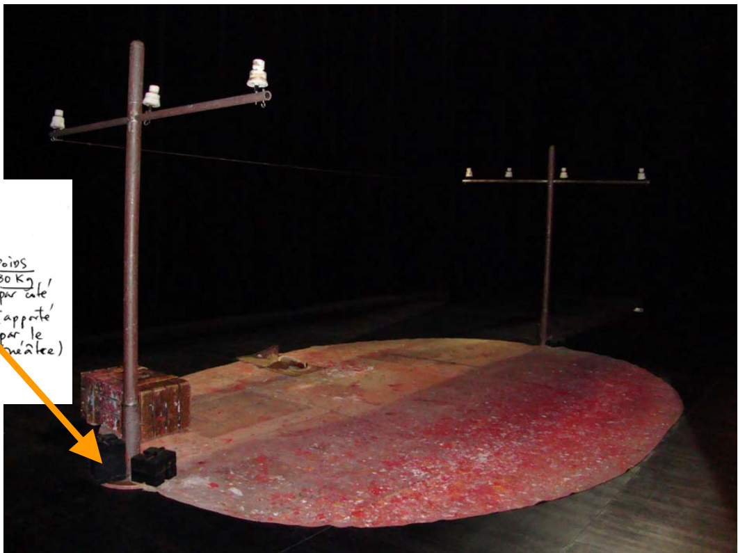
Structure scénographique (apporter 80kg de poids par côté)