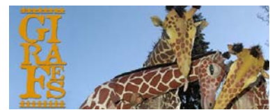
GIRAFES per tota la família / carrer