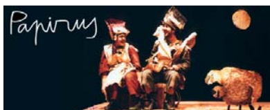
PAPIRUS a partir de 4 anys / sala ó carrer